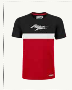
AFRICA TWIN T-SHIRT