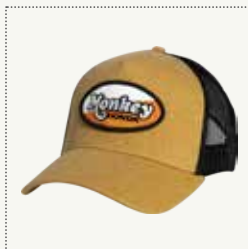
MONKEY TRUCKER- KAPPE