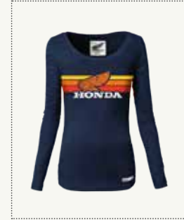
LADY SUNSET T-SHIRT