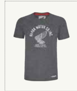
TECHNICAL RESEARCH T-SHIRT