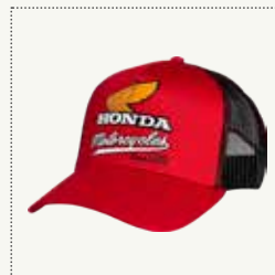
ELSINORE TRUCKER- KAPPE