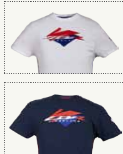
CBR FIREBLADE T-SHIRTS