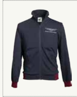
GOLD WING JACKE