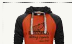
MAKING LEGENDS HOODIES